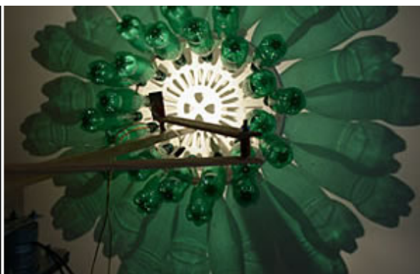
"Mandala Perrier in the series Blue Decline", 2002 © Diane Landry

För första gången sedan föreningen Electrohype sjösatte sina biennaler för elektronisk konst för tio år sedan har man sökt sig bortom Malmö/Lund-regionen. Ståtliga Ystads konstmuseum har med sin regionala profil en atmosfär väsensild exempelvis Malmö konsthall där föreningen tidigare huserat. Flytten från storstad till landsbygd, från konsthallar till konstmuseum, är inte betydelslös för hur den elektroniska konsten framstår. Betydelslös är inte heller årets medvetna styrning mot elektronik såsom objekt.