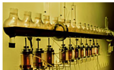
"Epiphora", 2009 © Yunchul Kim