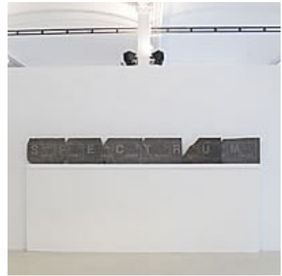
"Frieze", 2009 © Enrique Radigales