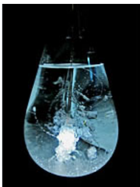
"Karat", 2009 © Sion Jeong