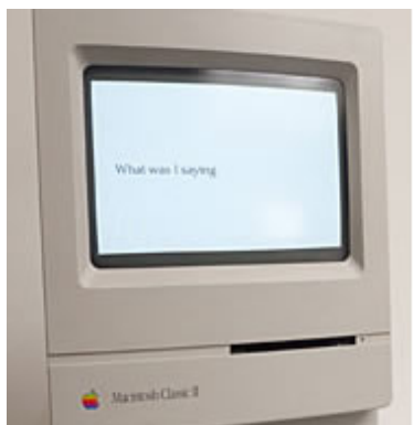
"Liquid Language", 1989 © David Rokeby