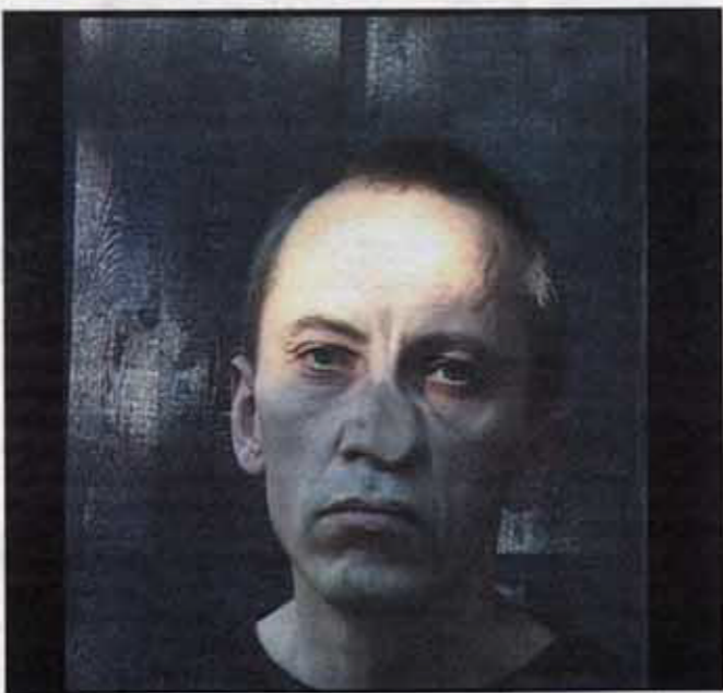
Utan titel. Interaktiv installation av Kristin Bergaust. (Electrohype: SPACE)